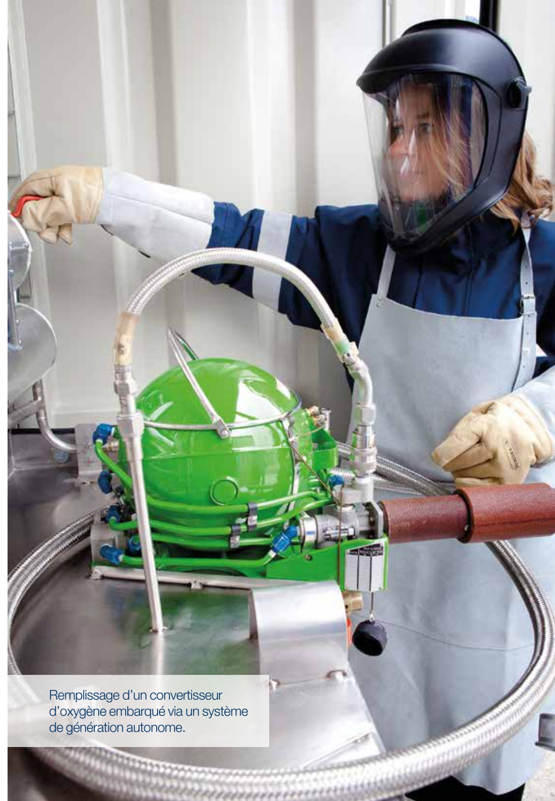
Remplissage d'un convertisseur d'oxygène embarqué via un système de génération autonome.

Le service support client aéronautique assure la maintenance préventive et curative des systèmes de génération de gaz embarqués et des matériels de support au sol pour garantir leur maintien en condition d'opération.